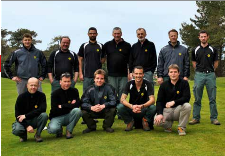
L'équipe de jardiniers de Chiberta prête à relever tous les défis de Dame Nature.