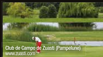
Club de Campo de Zuasti (Pampelune) www.zuasti.com