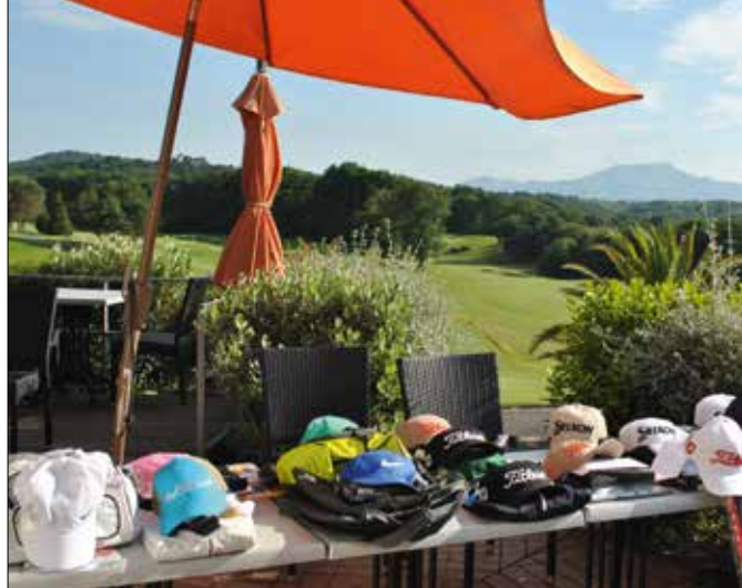
Parcours, stages, nouvelles compétitions... Les projets ne manquent pas pour donner au Makila Golf Club Bayonne Bassussarry la place qu'il mérite.