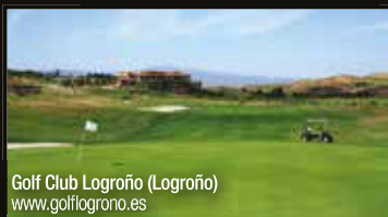
Golf Club Logroño (Logroño) www.golflogroño.es