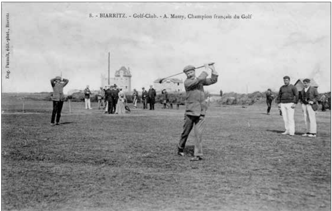
1908 Carte postale du Golf de Biarritz avec Arnaud Massy

Sur son acte de naissance, seul le prénom d'Arnaud est inscrit. Mais pour les Écossais de North Berwick, il a deux autres prénoms : George et Watson.