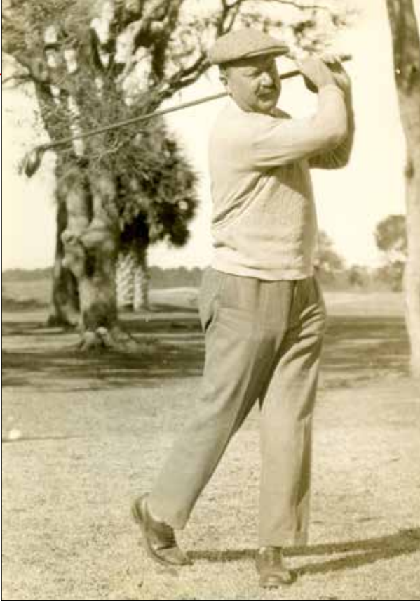
1926 Arnaud Massy à St-Augustine (USA) lors de sa tournée.

aussi un bon joueur. Il a participé au British Open de 1879 à 1894 et il a obtenu une excellente 6 ème place en 1888.