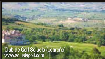
Club de Golf Sojuela (Logroño) www.sojuelagolf.com