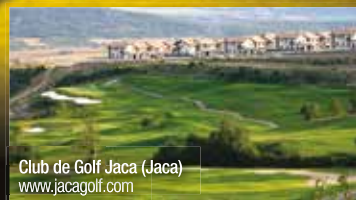
Club de Golf Jaca (Jaca) www.jacagolf.com