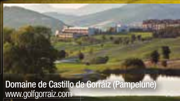
Domaine de Castillo de Gorraiz (Pampelune) www.golfgorraiz.com